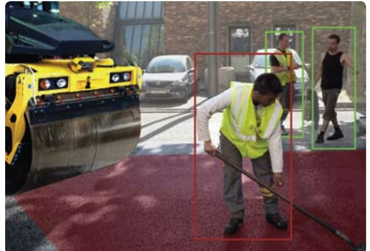
Fußgänger-Erfassungszone einer Straßenwalze: Blaxtair® erkennt alle Menschen in seinem Umfeld und warnt den Fahrer vor Fußgängern in der definierten Gefahrenzone (rot=innerhalb Gefahrenzone / grün=außerhalb Gefahrenzone).

Ein Fußgänger kann der Aufmerksamkeit des Fahrers entgehen, aber niemand entgeht der Wachsamkeit von Blaxtair®.